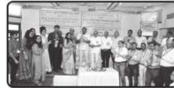
શ્રી વાગડ વિશ્વા ઓશવાળ ચોવીસી મહાજનના પ્રમુખશ્રી અને અન્ય પદાધિકારીઓ સાથે ટીમ SVGA