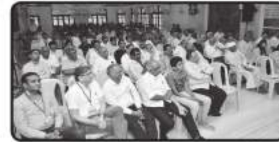
કાર્યક્રમ દરમિયાન હોલમાં ઉપસ્થિત મહાનુભવો અને શ્રોતાગણો