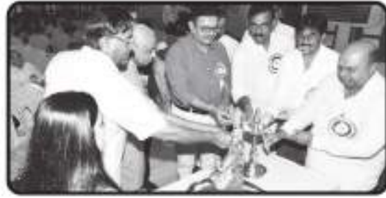
દાતાશ્રીઓ દ્વારા દિપ પ્રાગટ્ય